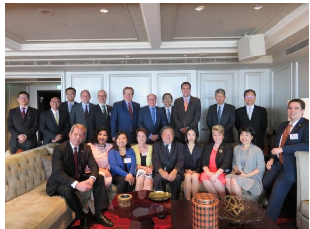
加拿大國會議員訪華團午宴團體照