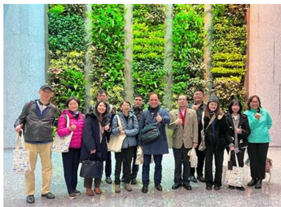
國經協會同仁參訪研華 AIoT 智能共創園區合影。