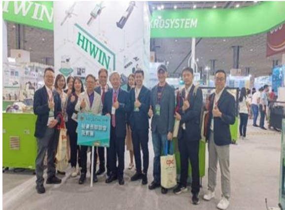
全體受邀貴賓合影。