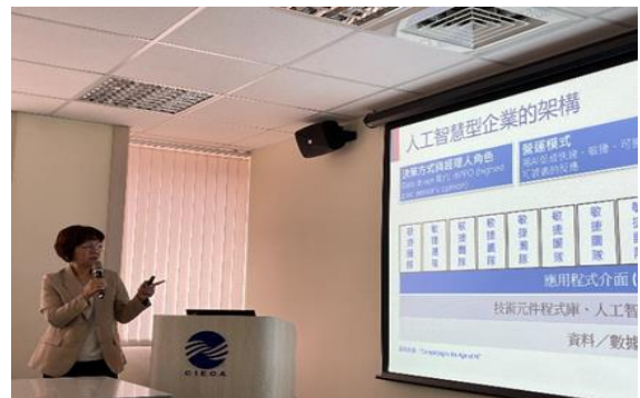
人工智慧科技基金會溫執行長分享簡報。