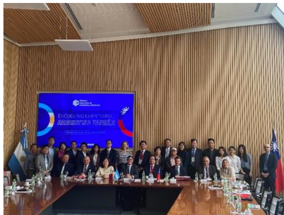
第 9 屆臺阿根廷經濟聯席會議與會貴賓合影。