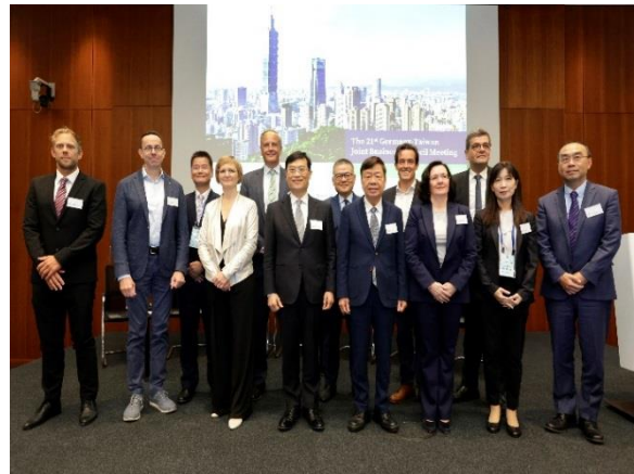
第 21 屆臺德經濟合作會議貴賓合影(左至右):