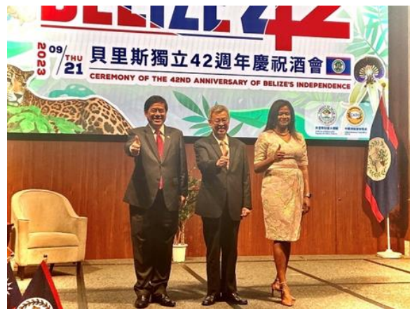
圖中由左至右：外交部常務次長陳立國、行政院長陳建仁、貝里斯駐台大使碧坎蒂 (Candice Pitts)。

台灣在聯合國體系中實現有意義參與。陳建仁行政院長以貴賓身分致詞，傳達政府及人民的誠摯祝賀，並感謝貝國於今年 4 月蔡總統到訪貝里斯時，國會一致通過「2023 支持民主台灣動議」，展現情義相挺。最後陳院長重申蔡總統的信念，強調我國會持續和貝國政府攜手堅守自由民主。