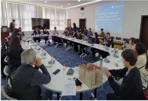
第 19 屆臺蒙（古國）經濟聯席會議。