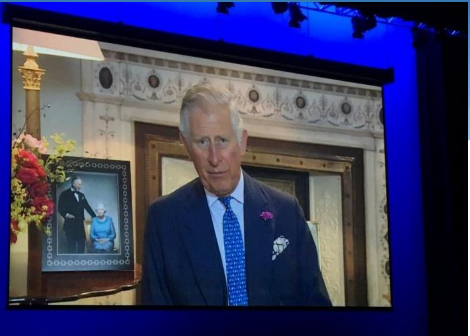
英國威爾斯親王查理斯王子於第 10 屆世界商會大會致歡迎詞視頻