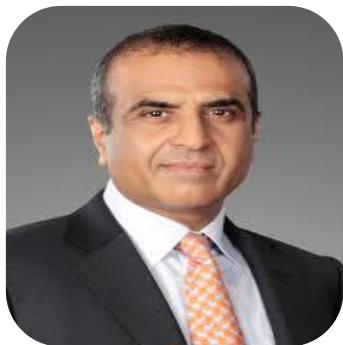
會長 Sunil Bharti MITTAL (印度籍) 2016年6月就任